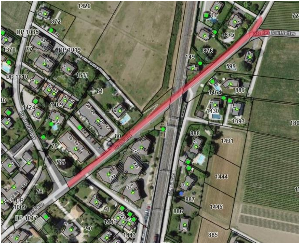
Vue aérienne du tronçon concerné par le projet

Dans le cadre de sa politique d'entretien et de maintien de la valeur des routes communales, la Municipalité a décidé de procéder à la réfection du tronçon de route (Grand'Rue) situé entre le carrefour avec la Route de Céliny et le carrefour entre le Chemin des Soufflettes et le Chemin des Verney.