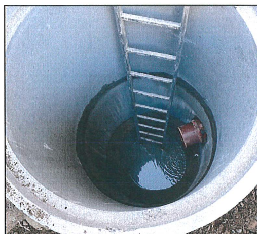
Nouveau regard de visite permettant le drainage et le curage des canalisations