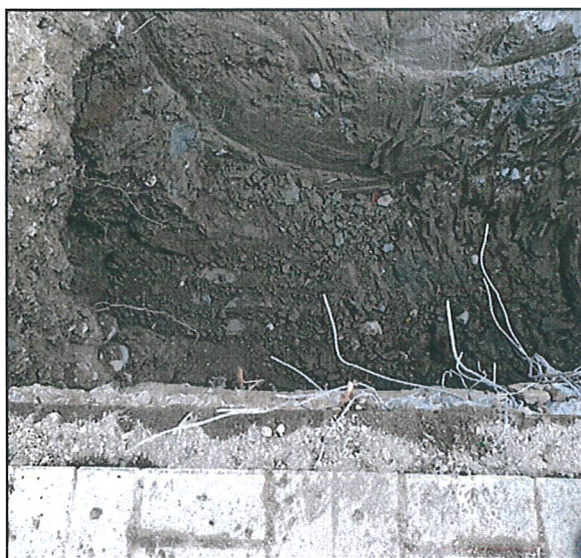
Premier trou effectué sur la base des plans